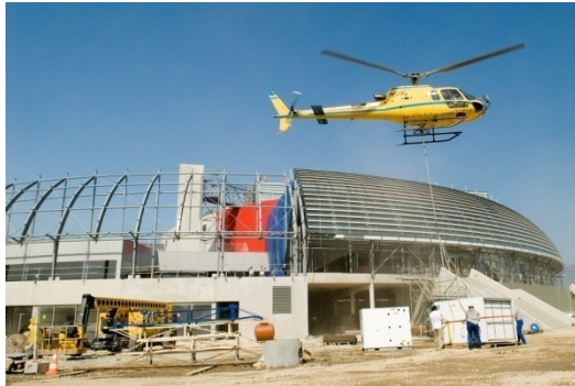
Hélicoptère des centrales d'air